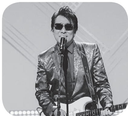
有線大衆賞 「朝やけの二人」レーモンド 松屋

昨年から新設された3賞「有線大衆賞」「ロングヒット賞」「ベストカラオケ賞」の受賞歌手がそれぞれの対象曲を歌唱し、その後盾を授与された。