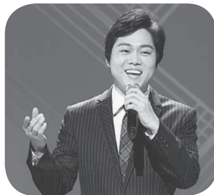
ベストカラオケ賞 「あやめ雨情」三山 ひろし