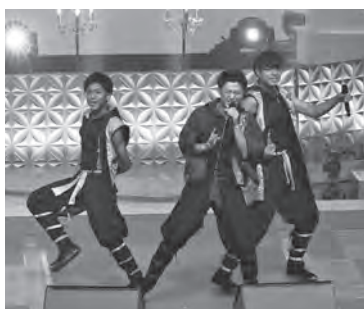
ベストパフォーマンス賞 「Sole ~おまんた囃子~」 東京力車