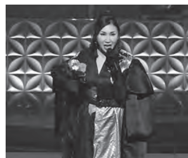
ロングヒット賞 「残酷な天使のテーゼ」 高橋洋子