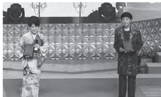
川中美幸 美川憲一