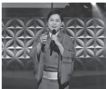
ベストカラオケ賞 「笹-こだま」 三山ひろし